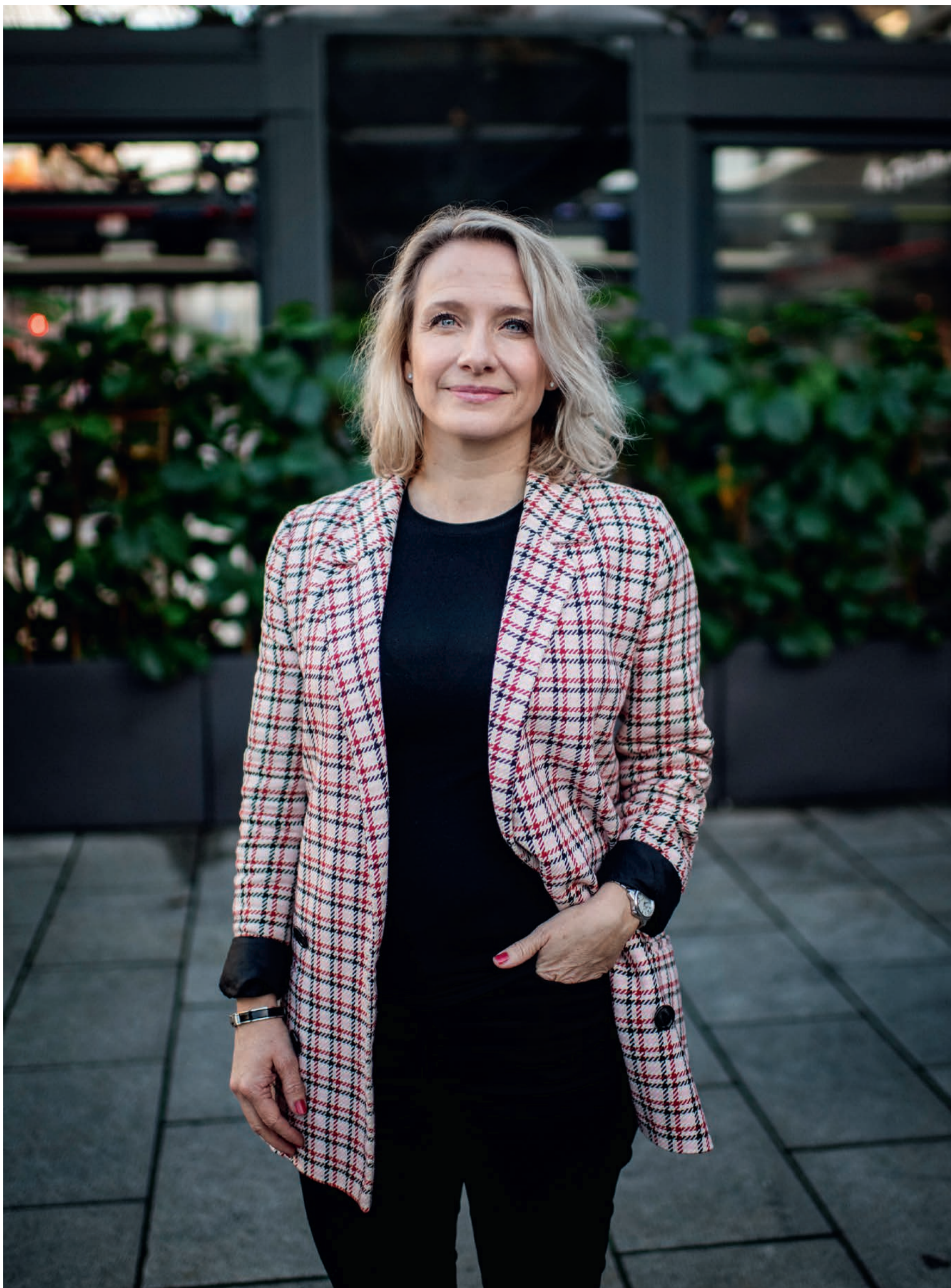
GLOBALT SELSKAP: I dag har Q-free kontorer og ansatte i 14 land verden over. Blant annet over 100 ansatte i USA.